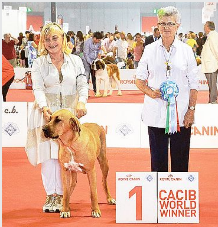
Bellini-Nynive, è la neo campionessa del mondo per la di razza Broholmer, eletta al Word Dog Show di Milano

BIGLIETTI aerei fantasma per New York, con soldi spariti e il falso venditore che si è dileguato nel nulla. Un 35enne della provincia di Catanzaro è stato denunciato per truffa dai carabinieri di Castel Maggiore per avere ideato e portato a termine un raggio online ai danni di una ragazza del paese della Bassa, riuscendo a incassare i soldi per due biglietti che non sono mai esistiti. Il giovane li aveva messi in vendita sulla rete spiegando che a causa di un'emergenza familiare avrebbe dovuto rinunciare al viaggio sognato per una vita. I due biglietti sono stati venduti per un importo di 1000 euro e la partenza era fissata proprio in questi giorni poco prima di Ferragosto. Il venditore fasullo aveva inviato anche una foto che a prima vista sembrava vera. Appena incassati i soldi, però, il truffatore è sparito nel nulla senza lasciare traccia. La giovane ha così segnalato l'accaduto agli uomini dell'Arma che hanno subito iniziato le indagini e identificato il truffante. La ragazza aveva sentito più volte per telefono il truffatore che si era dimostrato molto gentile. La donna non aveva mai sospettato che si trattasse della solita truffa online perché le foto dei biglietti sembravano davvero reali. Invece il 35enne in qualche modo deve essere riuscito a creare delle immagini fasulle dei titoli di viaggio.